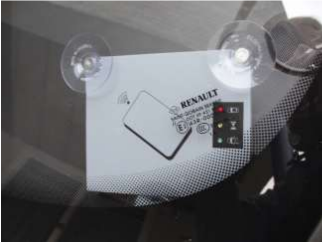
Kartenleser zum Öffnen an der Windschutzscheibe