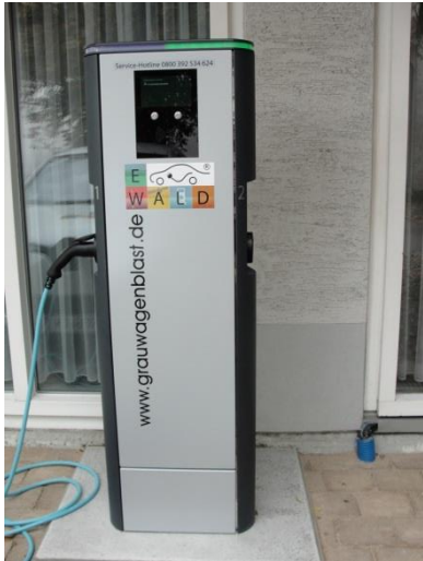
Ladesäule am Feuerwehrhaus in Heuchlingen

Im Rahmen eines Modellprojekts zur Elektromobilität hat der Gemeinderat beschlossen, ab Oktober ein Elektroauto für die Gemeinde Heuchlingen zu mieten. Das Fahrzeug wird zum einen für kommunale Zwecke genutzt. Genauso wichtig war aber auch, dass Einwohner mit einer gültigen Fahrerlaubnis das Auto bedarfsgerecht mieten können.