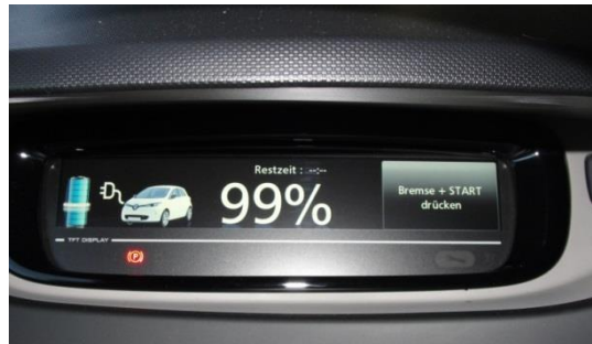
Displayansicht im Elektro- „Bürgermobil“